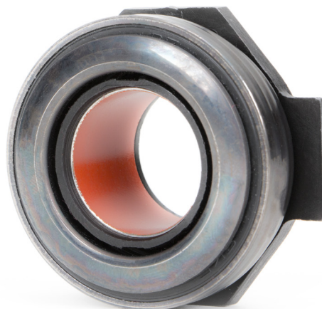
Рис. 3: Выжимные подшипники с втулками из PTFE не должны смазываться