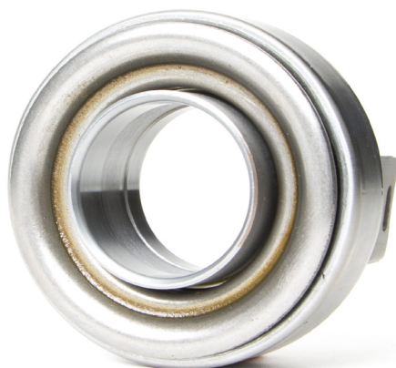
Рис. 1: Выжимные подшипники с металлическими втулками должны быть смазаны

Соблюдайте рекомендации автопроизводителя!