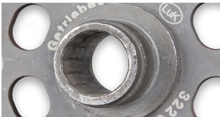
Рисунок 2: Поврежден профиль шлицов

В некоторых случаях, шлицы ведомого диска могут быть полностью разрушены, что приведет к отсутствию передачи крутящего момента (см. рис. 2).