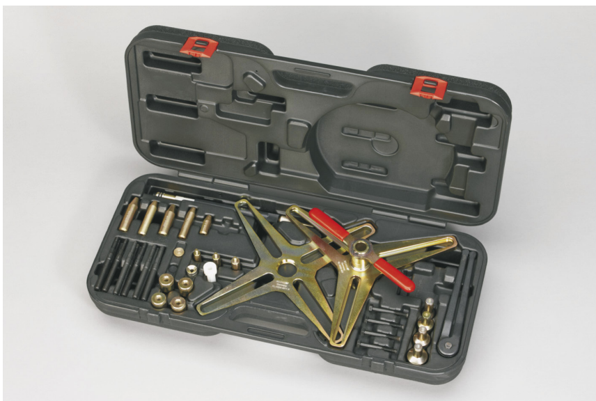
Рис. 2: 400 0237 10 - новый комплект специального инструмента с дополненным содержанием.

Новый комплект специального инструмента с добавленным содержимым есть в наличии и заменяет предыдущую версию.