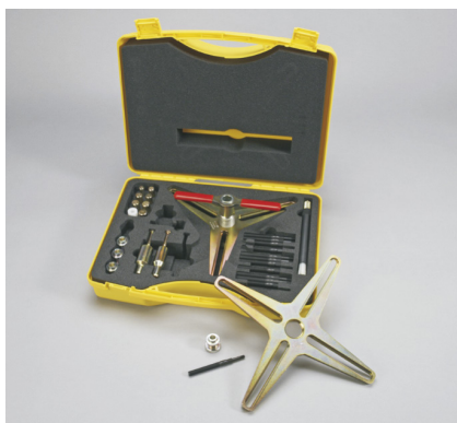
Рис. 1: 400 0072 10 - прежний комплект специального

Прежний комплект специального инструмента 400 0072 10 больше не поставляется и заменен на новый дополненный комплект 400 0237 10.