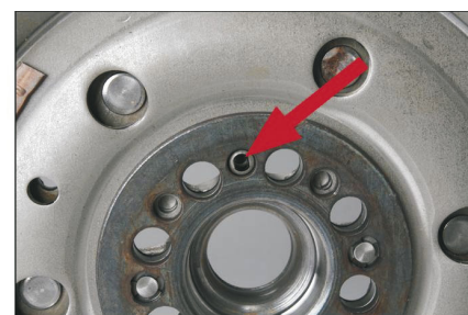
Рис. 2: Установочное отверстие в маховике (со стороны коленвала)

Двухмассовый маховик имеет возможность установки в разных положениях, при этом только одно из них верное. Во время монтажа двухмассового маховика обратите внимание, чтобы штифт коленвала попадал в отверстие на маховике. Отверстие в двухмассовом маховике опознается по треугольному знаку со стороны коробки передач.