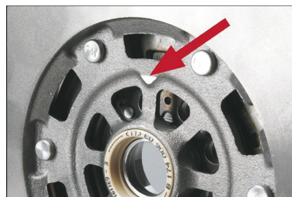
Рис. 3: Треугольный знак со стороны коробки передач

Соблюдайте рекомендации автопроизводителя!