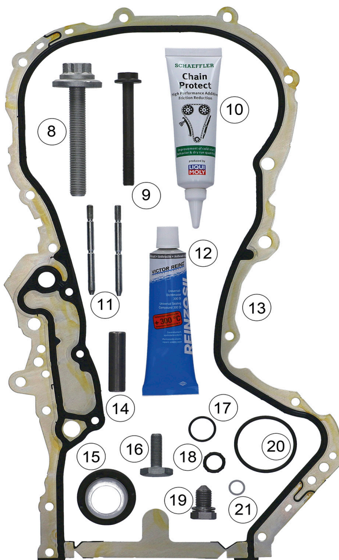
Рисунок 2: 559 0154 30/559 0154 31 – Состав комплектов привода ГРМ

Для обеспечения правильной установки привода ГРМ детали масляной системы и направляющие включены в оба ремонтных комплекта. Закрутите их в головку блока цилиндров и блок цилиндров.