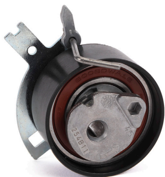
Рисунок 1: Натяжной ролик 531 0810 10

Обе версии соответствуют техническим спецификациям и могут применяться без ограничений. В переходный период могут встречаться как новые, так и старые версии.