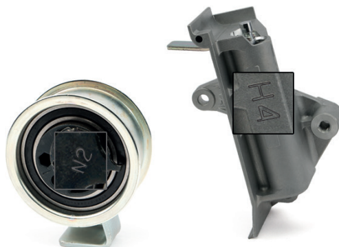
Фотография 2: Натяжной ролик 531 0436 20 с демпфером 533 0035 10