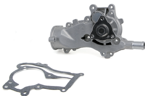
Рис. 1: 538 0314 10 – насос охлаждающей жидкости с прокладкой в комплекте

Насос охлаждающей жидкости 538 0314 10 герметизируется только прокладкой. Во время монтажа наносить дополнительный слой герметика ЗАПРЕЩАЕТСЯ.