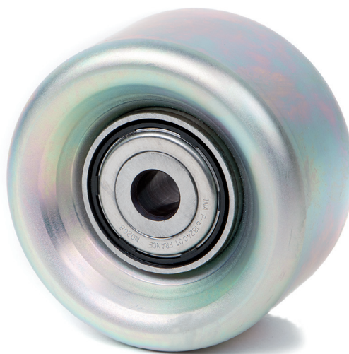
Рисунок 2: Новая конструкция

Смотрите актуальные данные в онлайн каталоге Schaeffler