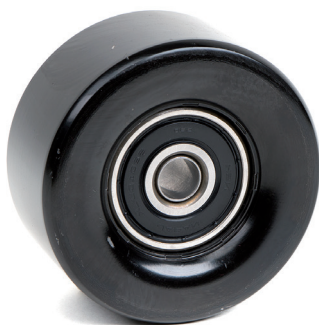
Рисунок 1: оригинальная версия

Конструкции обоих типов соответствуют техническим условиям и могут использоваться без каких-либо ограничений.