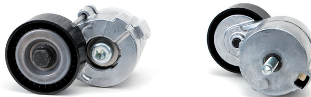
Рисунок 2: Новая конструкция

Как результат развития нашей продукции, корпус натяжителя системы ременного привода навесных агрегатов был оптимизирован для перечисленных двигателей. По этой причине прежняя версия натяжителя р534 0241 10 была заменена на 534 0610 10.