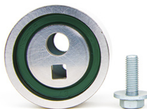
Рис. 2: 531 0780 10 - Натяжной ролик со встроенным болтом