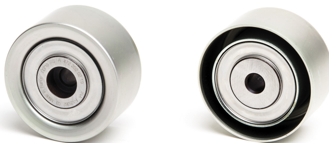
Рис. 2: Обводной ролик 532 0778 10

С перечисленными двигателями приводной ремень вспомогательной системы подвергается различным нагрузкам, в зависимости от конфигурации транспортного средства. По этой причине, производители автомобилей, устанавливают различные обводные шкивы с подшипниками соответствующего размера.