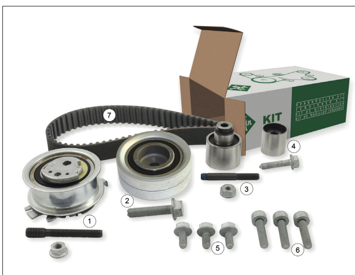
Рисунок 1: Ремонтный комплект натяжных роликов INA KIT 530 0550 10

Все компоненты ременного привода ГРМ разрабатываются таким образом, чтобы достичь одинакового ресурса и подвергаться одинаковому износу.