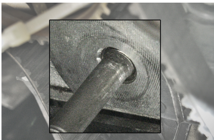
Рисунок 2: Штилька вкручена полностью

Номера деталей: 531 0203 20 530 0171 10 530 0171 30