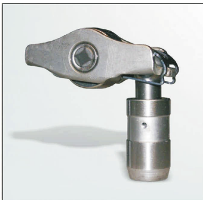
Рис 1: Конструкция 1

При замене коромысла и гидрокомпенсатора обратите внимание, что возможно применение двух вариантов конструкции (см. рис 1 и 2).