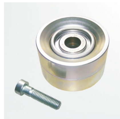
Рис. 2: 532 0410 20 – новая конструкция

Являясь частью наших непрерывных работ по улучшению продукции, были проведены изменения по опорному ролику, артикул № 532 0410 20. Это листовка с Сервисной Информацией указывает на визуальные отличительные признаки прежней и новой конструкции. Не касаясь различий в методе производства, новый ролик легче (657г по сравнению с 966г у прежнего ролика).