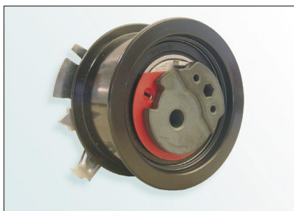
Рис. 1: 531 0628 30 (старая версия)

Эта техническая информация показывает визуальные характеристики «старой версии» и «новой версии».